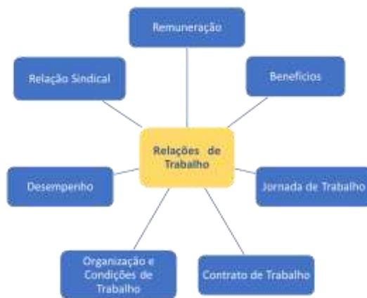
Figura 2: Relações de trabalho e seus aspectos